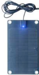
5 Watt - 56802