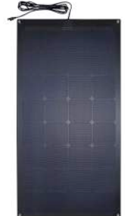
100 Watt - 56710