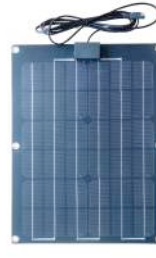
25 Watt - 56702