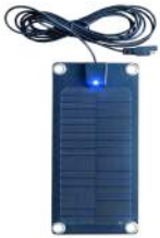
3 Watt - 56801