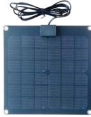
15 Watt - 56701